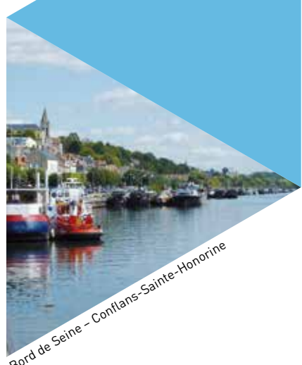
Bord de Seine - Conflans-Sainte-Honorine

01 | Construire une politique liée aux déplacements, notamment en préparant l'arrivée du RER Éole, considérée comme le levier de développement pour l'ensemble du territoire. La ligne sera prolongée jusqu'à Mantes-la-Jolie à l'horizon 2024 et d'ici-là, des quartiers vont être aménagés autour des futures gares RER. Penser le développement du territoire plus globalement en incluant les gares de la rive droite.