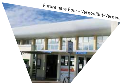
Future gare Éole - Vernouillet-Verneuil

02 | Valoriser la Seine de Mousseaux-sur-Seine à Conflans-Sainte-Honorine sur les plans paysagers, économiques, touristiques et de loisirs.