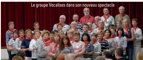
Le groupe Vocalises dans son nouveau spectacle