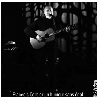
François Corbier un humour sans égal...