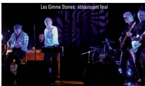
Les Gimme Stones: éblouissant final