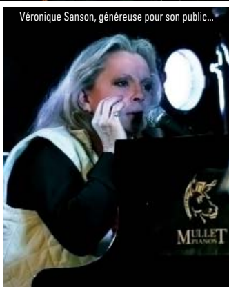
Véronique Sanson, généreuse pour son public...