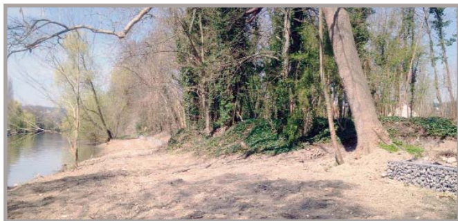
Les gabions installés en bord de Seine permettront aux futurs promeneurs de s'asseoir et regarder « couler la Seine ».