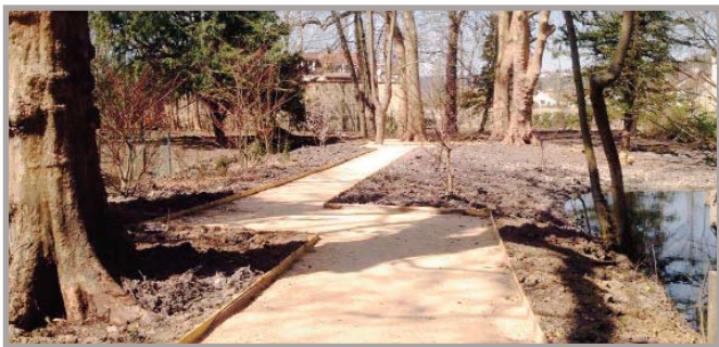
Vue du Chemin Barbaroux, l'allée longe le Ru Gallet, les pontons et caillebotis sont en cours de fabrication et doivent être posés avant fin avril.