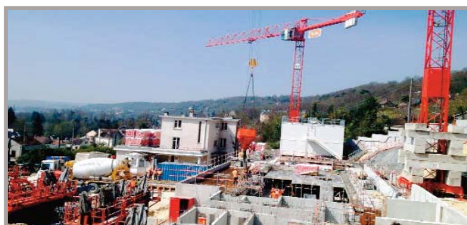
Le chantier en pleine activité sur la partie Est, la maison de l'ancienne propriété au centre est conservée et abritera 3 logements