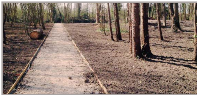
L'allée tracée du Chemin des clos à la Seine permet de traverser la partie sud du Parc.