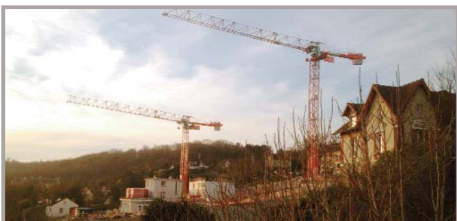
Les deux grues surplombent le chantier depuis début mars