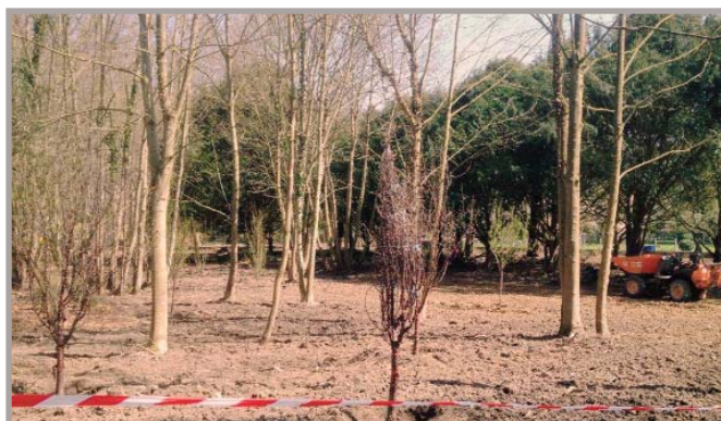
Les travaux de débroussaillages et de coupes terminés des arbres nouveaux sont replantés dont quelques fruitiers