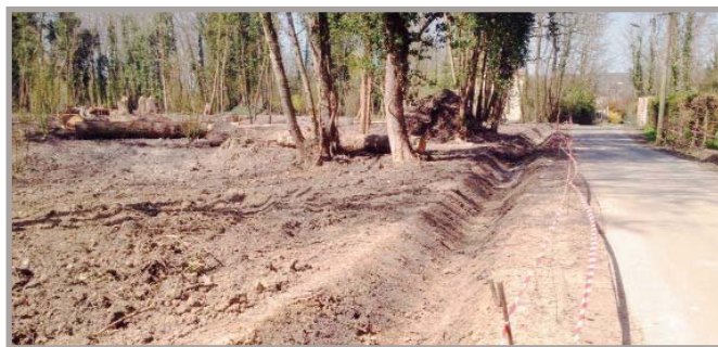
Un fossé assez profond en bordure du chemin des clos évitera le franchissement des engins motorisés