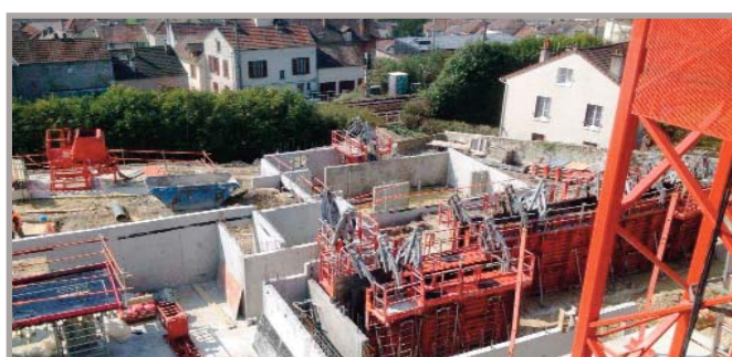
La partie Sud-Ouest abritera 14 logements