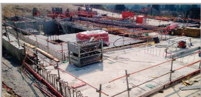
Sur la partie Est du chantier qui abritera 23 logements, le sous-sol et parking sont pratiquement terminés en gros œuvre, le plancher du rez de chaussée est déjà bien avancé.