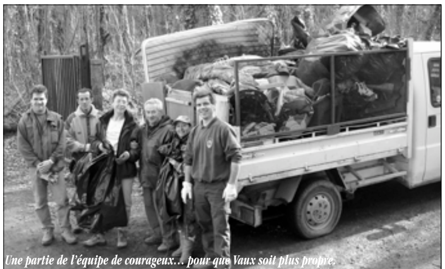
Une partie de l'équipe de courageux... pour que Vaux soit plus propre.

E N ce samedi matin de 1 er avril, une quinzaine de courageux dont trois enfants ont parcouru quelques rues et chemins, rempli sacs et camions de détri- ➔